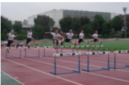
市内陸上競技大会