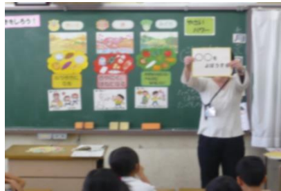
栄養教諭参加の食育指導