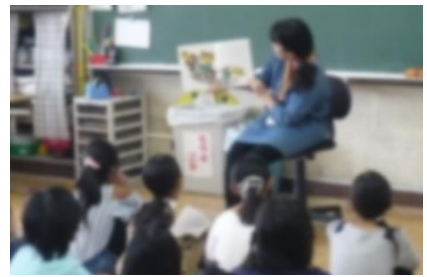
ボランティアによる読み聞かせ